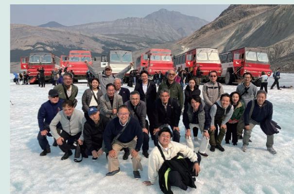
コロンビア大氷原での記念写真