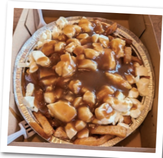
大好きなプティン

モントリオールのどの角を曲がっても発見があり、どの季節に訪れてもユニークな体験ができます。ぜひ、いつでも訪れてみてください!