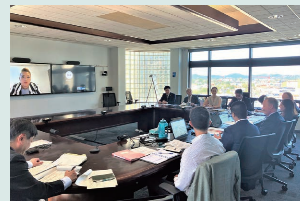
BC州政府表敬訪問での意見交換会の様子