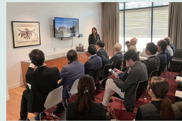
UBC人類学博物館での中村教授講座の様子