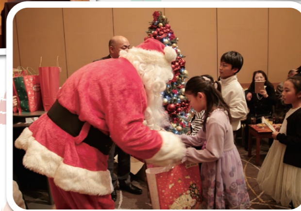
◀サンタさんから プレゼント