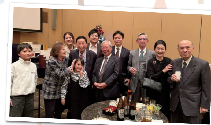
▲参加者のみなさん