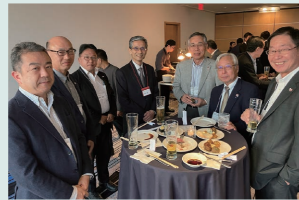
バンクーバーでの交流会の様子